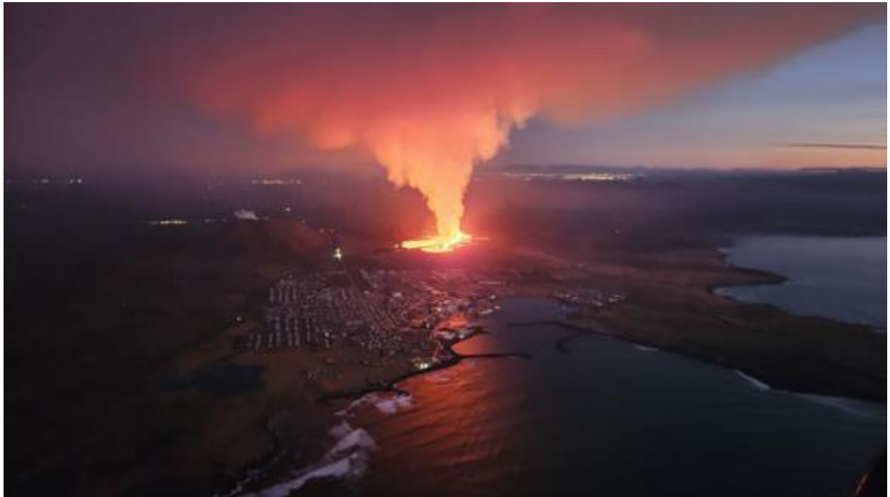
2 Eldgosið séð úr eftirlitsflugi með Landhelgisgæslunni rétt fyrir hádegi 14. janúar.

Ferðamálastofa hefur einnig óskað eftir því við aðgerðastjórn Almannavarna á Suðurnesjum að skilgreint verði lokað svæði í kringum gosstöðvarnar og Grindavík þar sem að hætta er í raun til staðar. Það sé ekki ásættanlegt að meirihluti Reykjanesskagans skuli vera lokaður þegar þess er ekki þörf. Þá hefu Ferðamálastofa einnig óskað eftir því að lokanir á vegum að Grindavík verði færðir nær Grindavík eins og gert var eftir ábendingar Ferðamálastofu í desember þegar lokanir voru færðar að afleggjara að Brimkatli og bílastæði við Fagradalsfjall. Það er mikilvægt að við höludum eins mörgum áfangastöðum opnum og mögulegt er án þess að stofna til hættu.